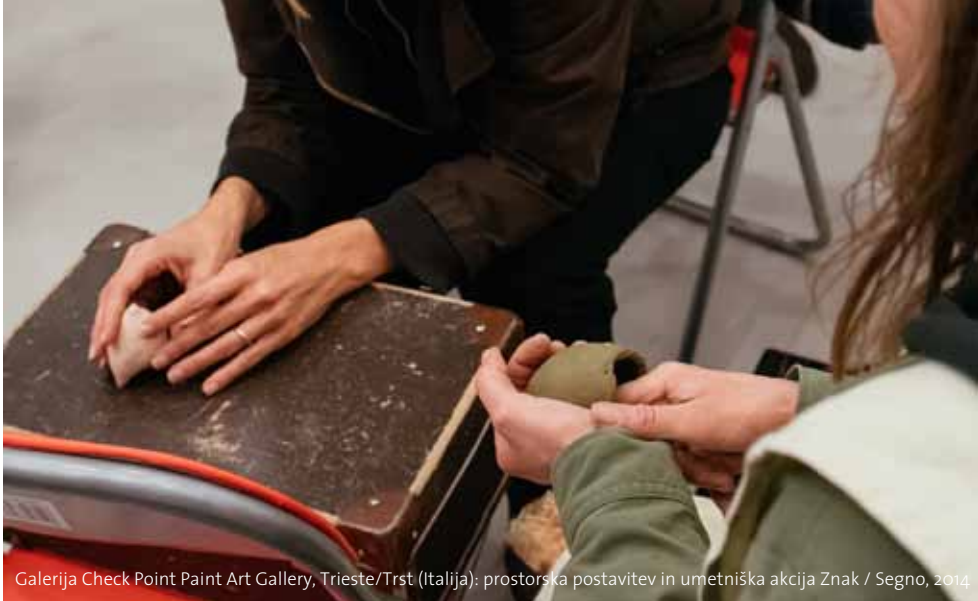
Galerija Check Point Paint Art Gallery, Trieste/Trst (Italija): prostorska postavitve in umetniška akcija Znak / Segno , 2014