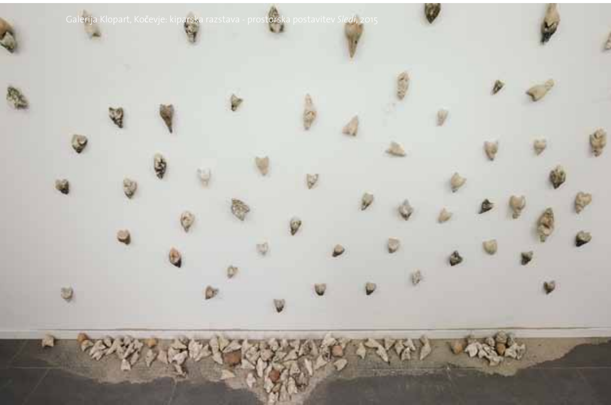
Galerija Klopert, Kočevje: kiparska razstava - prostorska postavitev Sledi , 2015

(1967, Celje) je leta 1998 končala študij likovne pedagogike na Pedagoški fakulteti v Mariboru. Med letoma 2004 in 2007 je v Moskvi raziskovala haptično umetnost. Z njo se ukvarja tudi v interaktivnem projektu v razvoju Ne dotakniti se . Področja umetničinega ustvarjanja so: kiparstvo, prostorska instalacija, interaktivna akcija in fotografija. Svoje delo je predstavila na razstavah in prireditvah v Sloveniji in tujini. Živi in ustvarja v Bistrici pri Lesičnem.