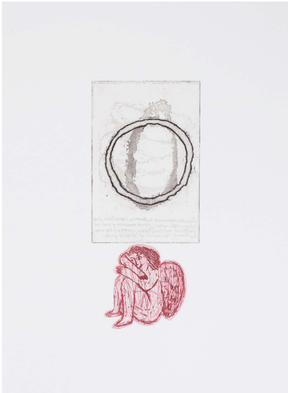
Nataša Mirtič, iz cikla Dve v vrsto , z intervencijo V. Drnovšek, 2019, jedkanica, akvatinta, 71 x 42 cm.