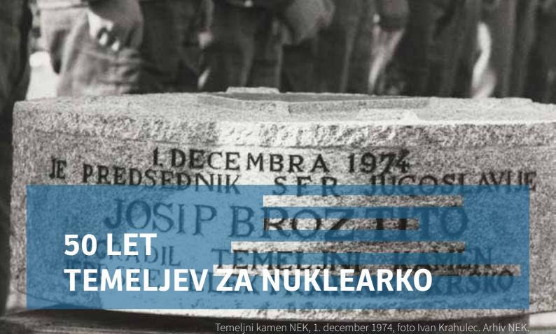
Temeljni kamen NEK, 1. december 1974, foto Ivan Krahulec. Arhiv NEK.