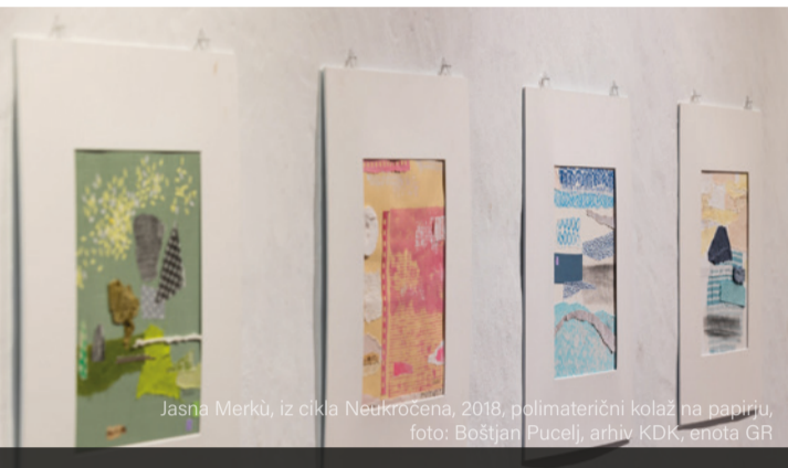
Jasna Merku, iz cikla Neuročena, 2018, polimaterični kolaž na papirju, foto: Boštjan Plucelj, arhiv KDK, enota GR

Ob odprtju bo z nami tudi dedek Mraz s snežinkami.