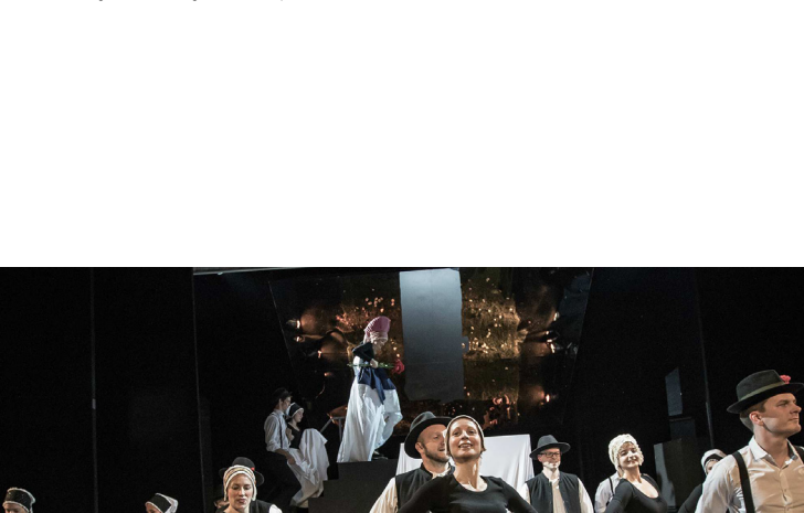
serija Paris In And Out

Informacije in najave: E: info@gradrajhenburg.si T: 07 620 42 16 M: 051 475 675