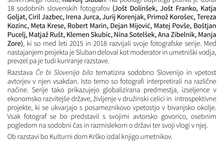
Fotografija © Irena Kozinc, serija Paris In And Out

Mascara Quartet je prepoznavna zasedba v domačem in širšem umetniškem prostoru, sodelujejo s številnimi posamezniki, komornimi skupinami, orkestri, ansambli, koncertnimi dvoranami in festivali doma in v tujini.