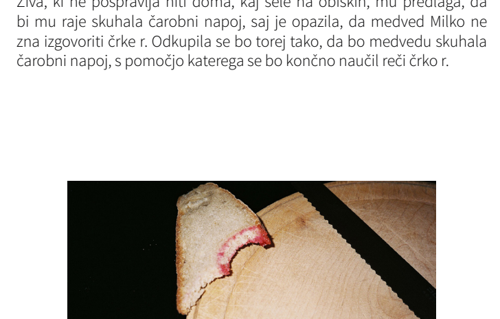
serija Paris In And Out

Po projekciji sledi še pogovor z režiserjem Darkom Stantetom .