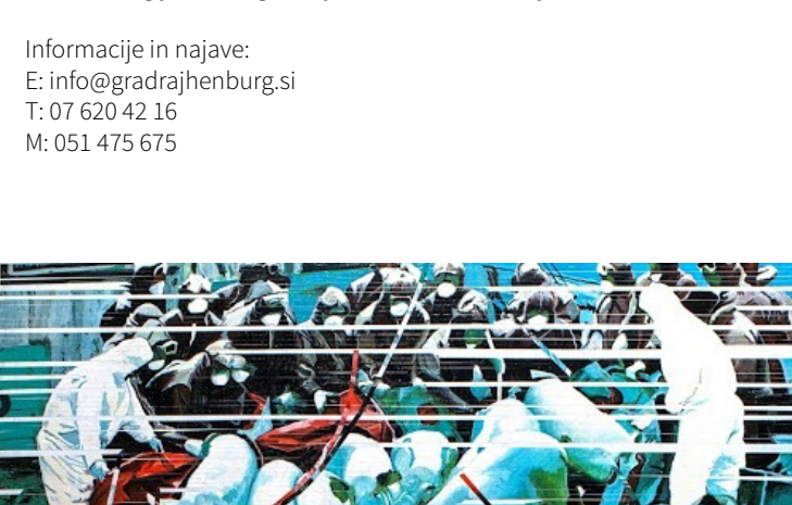
Fotografija © Mito Gegič, Carnival, 2018, akril, 252x152 cm, detajl

Organizacija: Zavod Friderik I. Baraga in Kulturni dom Krško