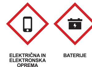
ELEKTRIČNA IN ELEKTRONSKA OPREMA

Zbiranje po posameznih postajah poteka v točno določenem terminu, zato pozivamo, da se držite urnika in odpadke oddate osebno na posamezni postaji. Vsako nekontrolirano puščanje odpadkov na raznih mestih bo evidentirano in prijavljeno na Medobčinski inšpektorat Krško.