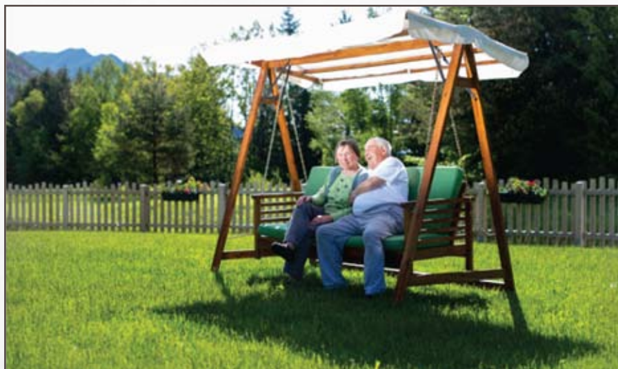
V parku.