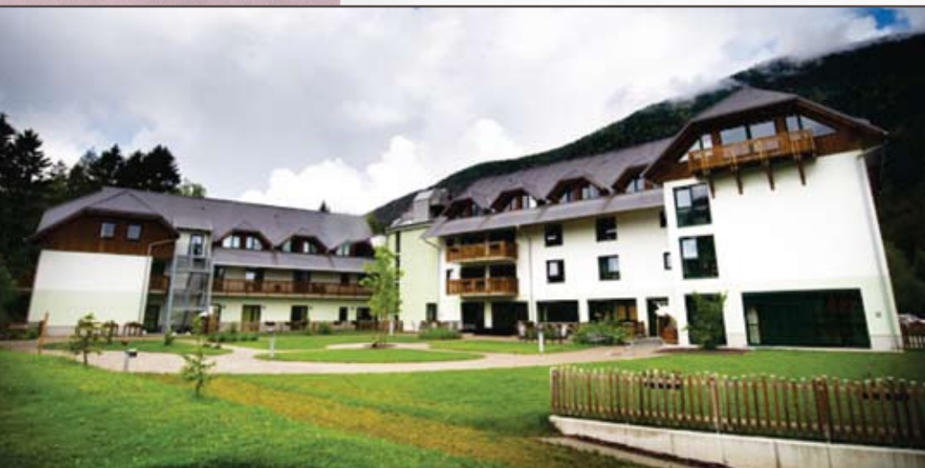
Dom z okolico.