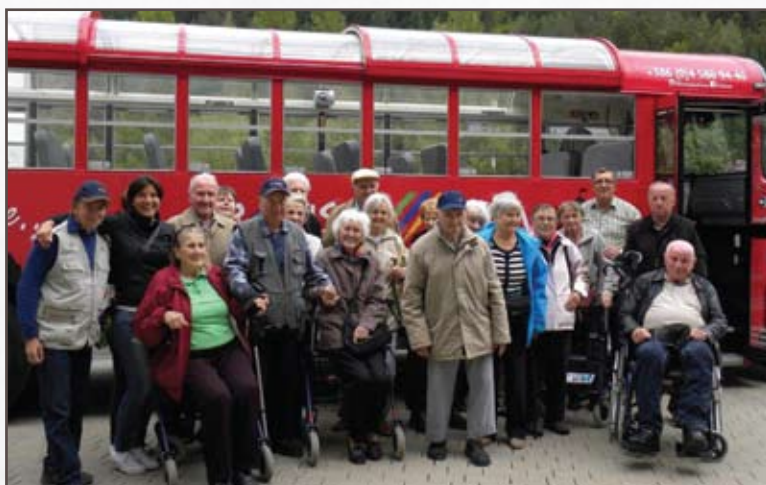
Na izletu.

Svoje izdelke pa vsakič postavimo na ogled tudi pred božičnimi in velikonočnimi prazniki na domskem Bazarju.