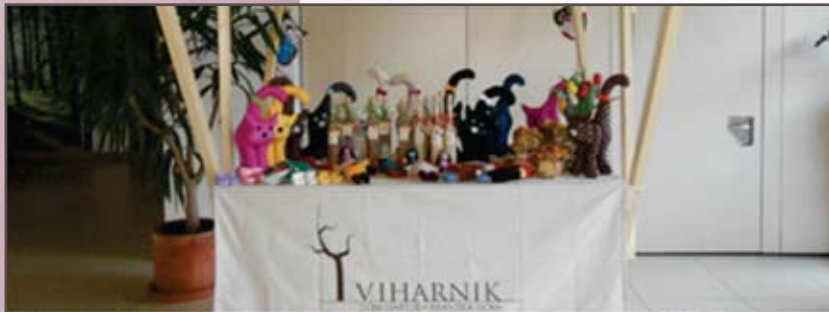
Bazar, razstava, kava v Kranjski Gori.