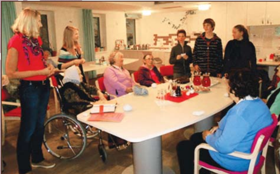
Most besed.