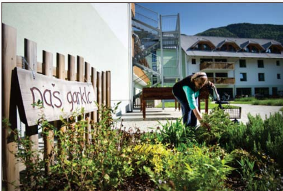
Urejanje garklca.

delovne terapije se bo še naprej spodbujalo medgeneracijsko sodelovanje med stanovalci in dijaki BC Naklo ter učenci OŠ Josipa Vandota Kranjska Gora. Svojo uporabno vrednost pa je projekt pridobil tudi skozi oblikovan priročnik za delovne terapevte, ki bo služil za uvajanje dvignjenih gred in hotelov za koristne organizme v delovno terapijo.