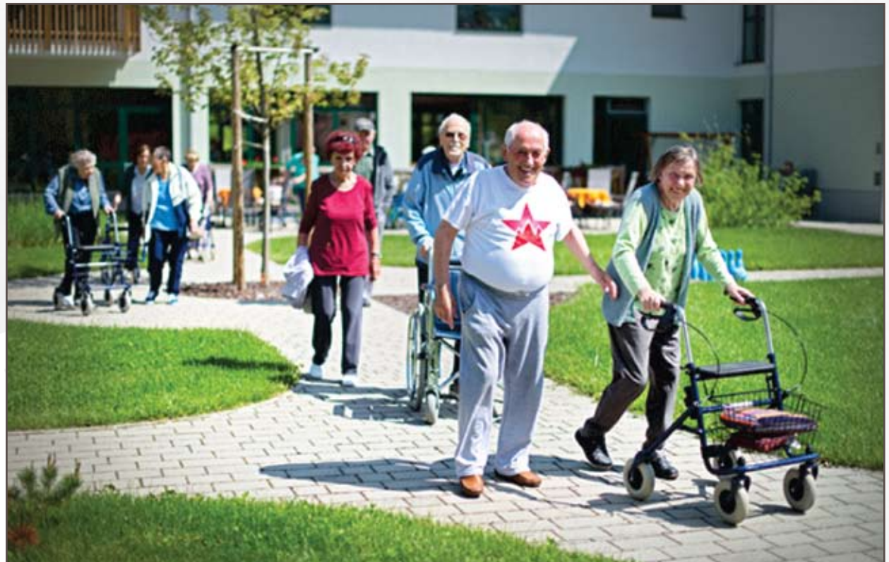
Na sprehod.

Stanovalci so se v dom vseljevali počasi, kar lahko pripisujemo krajevni oddaljenosti ter pokritosti gorenjske regije z domovi za starejše. Najprej so bila zapolnjena mesta na skupinah stanovalcev z demenco ter na negovalnih skupinah. Slednje sovпада s povpraševanji za namestitve, ki so najbolj izražena prav za ti dve skupini.