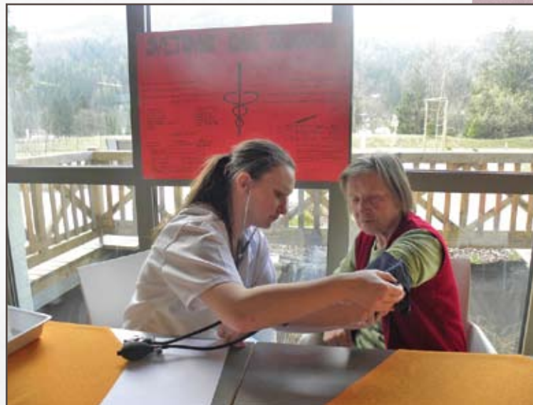
Klinično usposabljanje.

in diagnostično terapevtskih postopkov in posegov, saj stanovalci potrebujejo delno ali popolno pomoč pri izvajanju življenjskih aktivnosti. Poleg tega se študenti učijo komuniciranja in socialnih veščin preko zagotavljanja bližine in varnosti ter številnih aktivnosti, ki so organizirane v učni bazi. Prav tako se študenti vključujejo v aktivnosti ob mednarodnih in svetovnih dnevih zdravja.