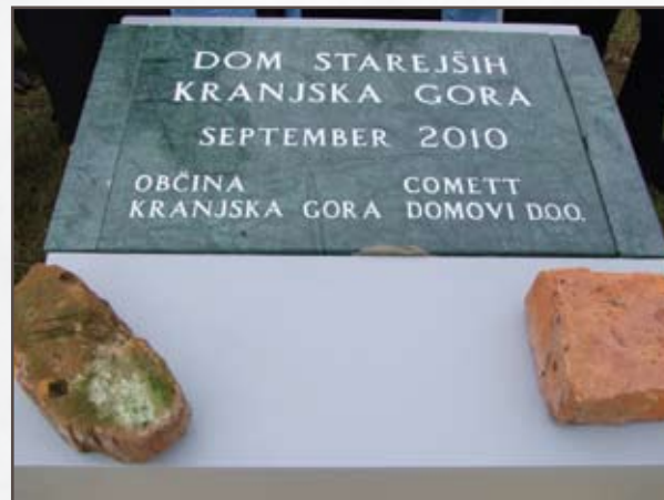
Temeljni kamen, september 2010.