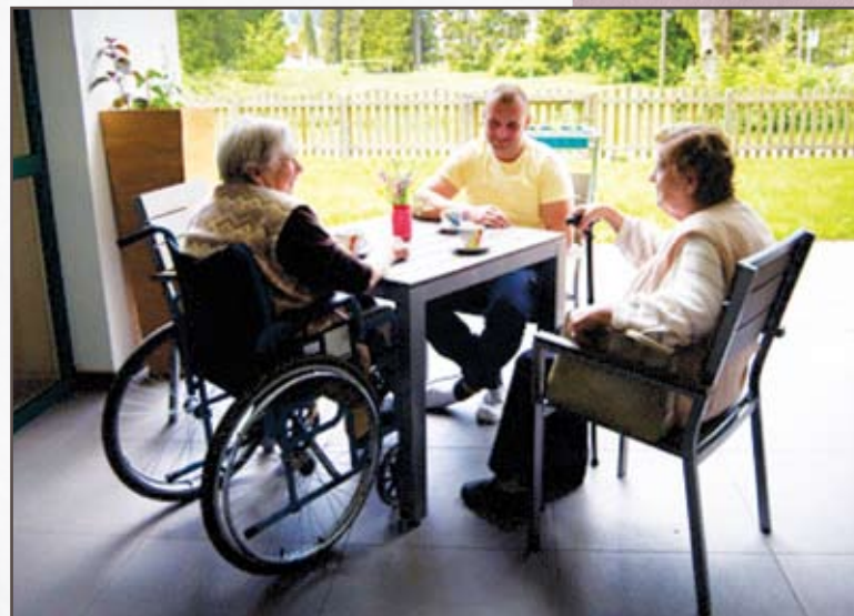
Popoldanska kavica na terasi skupine Povest o dobrih ljudeh in Cvetje v jeseni.

Negovalna skupina v prvem nadstropju nosi ime po literarnem delu Severni sij , ki ga je napisal Drago Jančar. Dom stoji v prijetnem alpskem okolju. Ko smo stanovalce negovalne skupine drugega nadstropja spraševali po imenovanju njihove skupnosti, so se enoglasno odločili za Tavčarjevo delo. Vitalni gospodinjski skupini v drugem nadstropju pa sta se poimenovali po znani knjigi, ki jo je spisal Prežihov Voranc. Ko se povzpemo v drugo nadstropje je torej na eni strani skupina Med gorami , na drugi pa ji družbo delajo Samorastniki . V mansardi si je skupina nadela ime po naslovu prvega slovenskega zvočnega celovečernega igranega filma Na svoji zemlji .