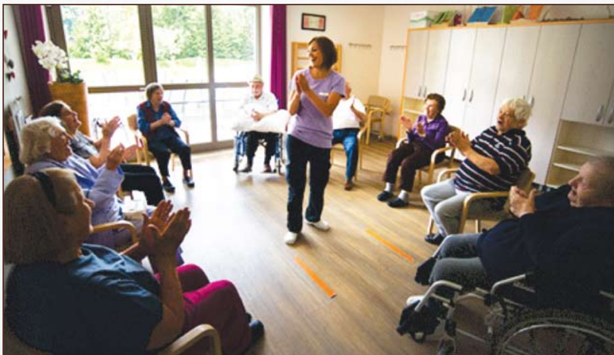
Joga smeha.

zelo učinkovito deluje kot dopolnilna terapija za ohranjanje zdravja in boljšega počutja. Prav to, dobro voljo in dobro počutje ter predvsem nasmeške na obrazih, si želimo ohranjati pri nas. Naše vodilo je: »Smej se in življenje bo lepše.«