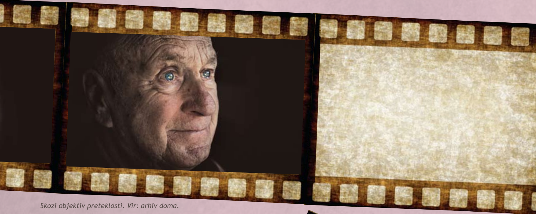
Skozi objektiv preteklosti.