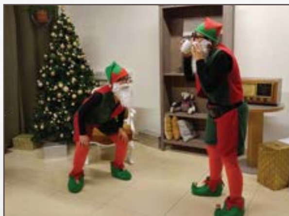
Obisk pravljinih junakov.