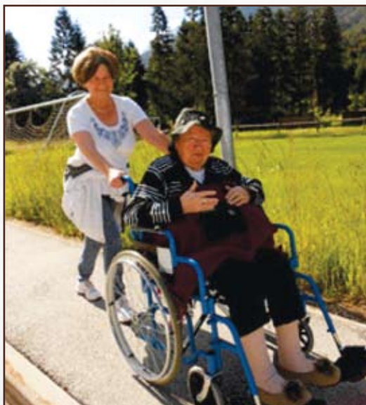
Prostovoljka in stanovalka.