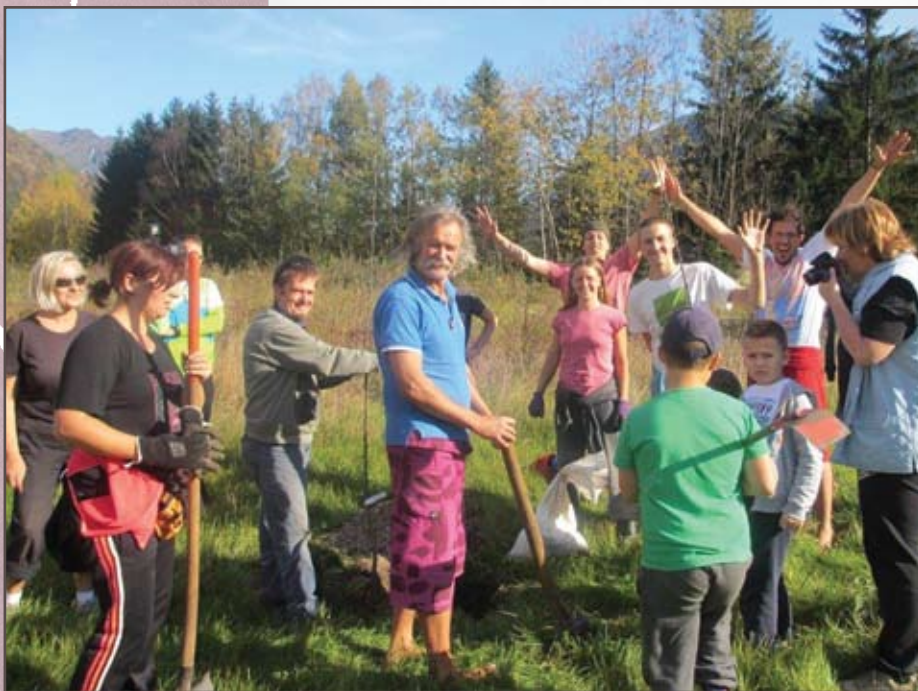
Zasaditev dreves.

V projekt sta vključeni tudi obe lokalni osnovni šoli (OŠ 16. december Mojstrana in OŠ Josipa Vandota Kranjska Gora) ter dom Viharnik. S sodelovanjem občanov, ki so za uspeh takšnega projekta ključnega pomena, nam je na obrobju doma uspelo zasaditi dvanajst nizko raslih jablan ter šestnajst grmovnic, ki bodo nekoč nudile prijetno zavetje v senci, s čudovitim pogledom na park doma in njegovo okolico.