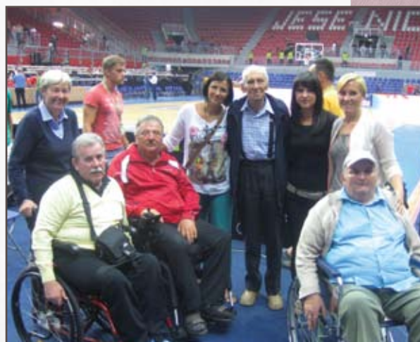
Evropsko prvenstvo v košarki.