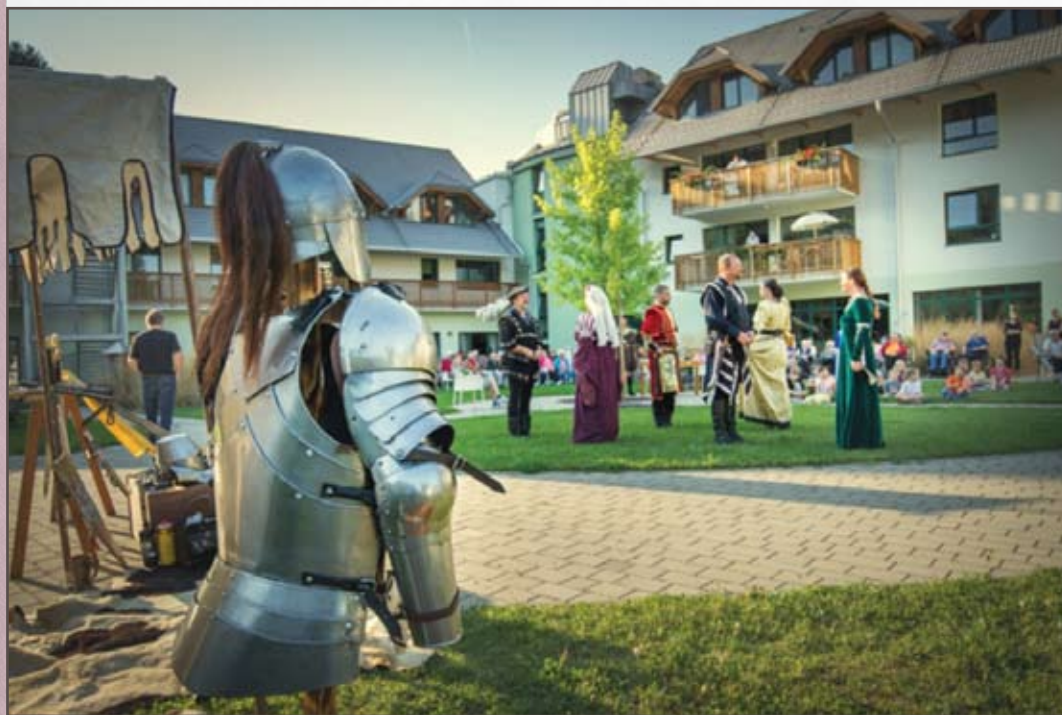
Vitezi v Viharniku.