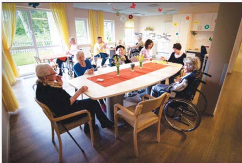
Gospodinjska skupnost.