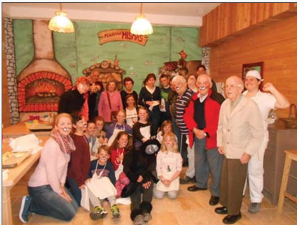
Pekarna mišmaš.

Prav posebna izkušnja je bilo sodelovanje z Razvojno agencijo zgornje Gorenjske v projektu Mladi razveseljujemo starejše. V petih različnih delavnicah in na zaključnem izletu v Planinski muzej so se stkale posebne vezi, ki so za sabo pustile lepe spomine.