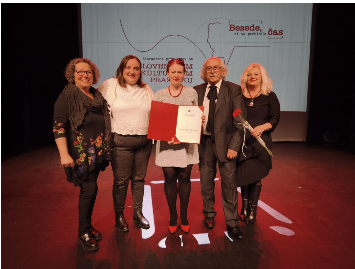
Slika 3: Ekipa društva ob sprejemu priznanja Zveze kulturnih društev Brežice na občinski prireditvi 6. 2. 2026

Vir: https://www.zkd-brevice.si/sl/novice/prejemniki-priznanj-in-odlicij-zveze-kulturnih-drustev-brevice-za-leto-2025