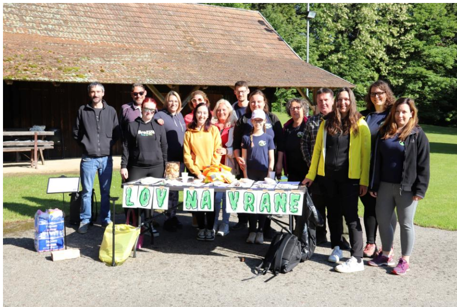
Slika 11: Skupinska fotografija članov, sodelujočih pri Lovu na vrane, v letu 2025