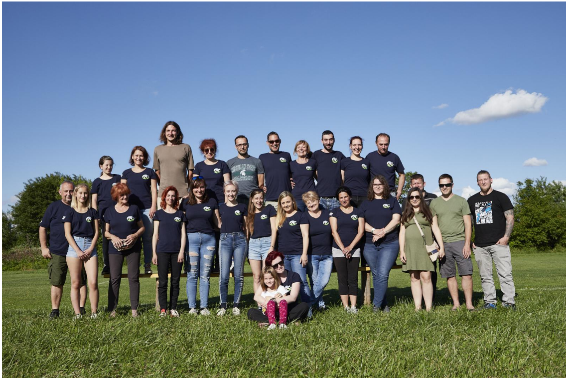
Slika 2: Skupinska fotografija Kulturno umetniškega društva Mokriške vrane s podporniki

Povezovati želimo umetnost, kulturo, skupnost in aktualna družbena vprašanja, krepiti lokalno identiteto ter prispevati k razvoju kulture in civilne družbe. Želimo biti prepoznaven, relevanten in drzen akter kulturnega in družbenega dogajanja, ki iz lokalnega okolja ustvarja prostor za umetnost in kulturo, kritično razmišljanje in aktivno skupnost. Naša vizija je skupnost, v kateri kultura ni dekoracija, temveč orodje za spremembe, umetnost pa sredstvo povezovanja ljudi, generacij in idej – lokalno, nacionalno in mednarodno.