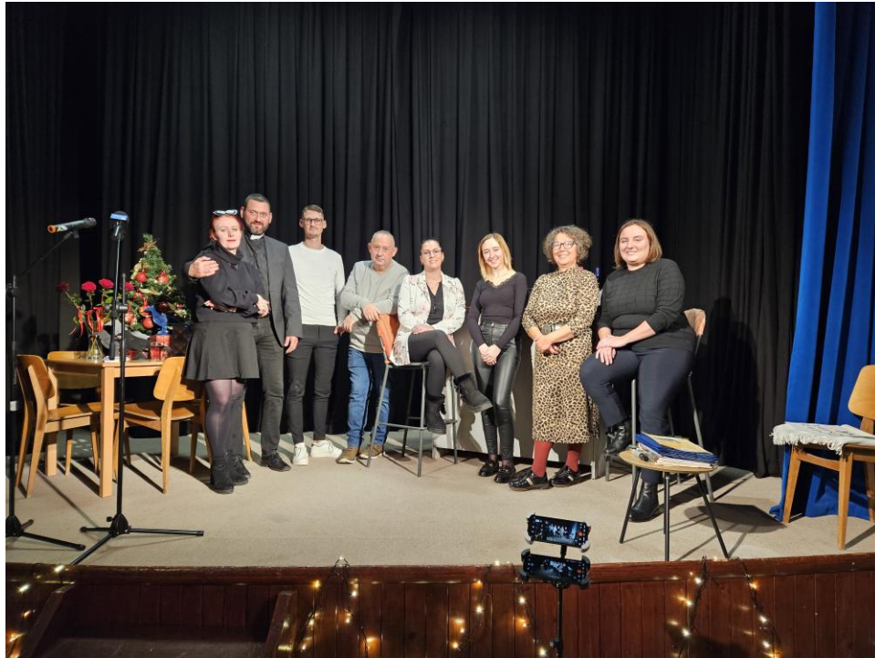
Slika 7: Skupinska fotografija članov društva na prireditvi Ta veseli dan kulture 2024

Vsaki dve leti organiziramo prireditve, katere osrednji namen je podelitev priznanj najbolj aktivnim članom v obdobju zadnjih dveh let in predstavitev dosežkov društva. Podelimo tudi morebitna druga priznanja, letos bomo podelili priznanje prvi skupini za kulturno orientacijski pohod. Na prireditvi bosta sodelovali obe sekciji s predstavitev svojega delovanja. Prireditve predvideva sodelovanje Kulturno umetniškega društva Slavček ter njihove sekcije Vaška scena. Povabili bomo tudi ključne deležnike: Občina Brežice, JSKD OI Brežice, ZKD Brežice, Zavod Dobra družba ter podelili zahvale za sodelovanje. Letošnja izvedba bo tretja.