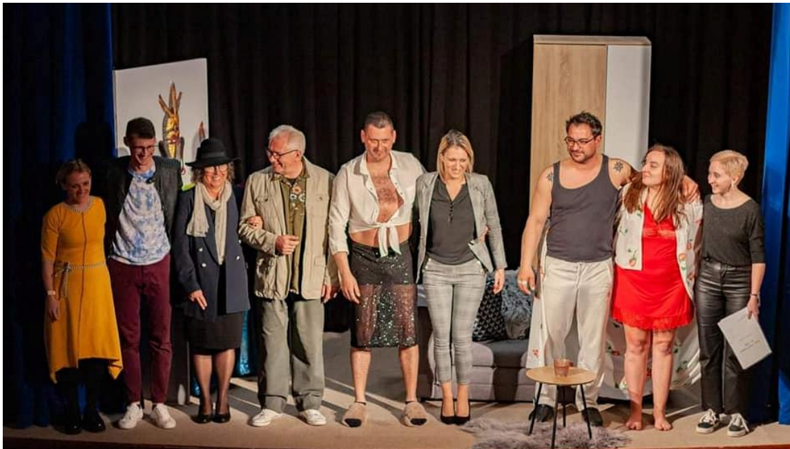
Slika 8: Skupinska fotografija članov Špil teatra iz predstave Brat od svoje sestre iz leta 2023