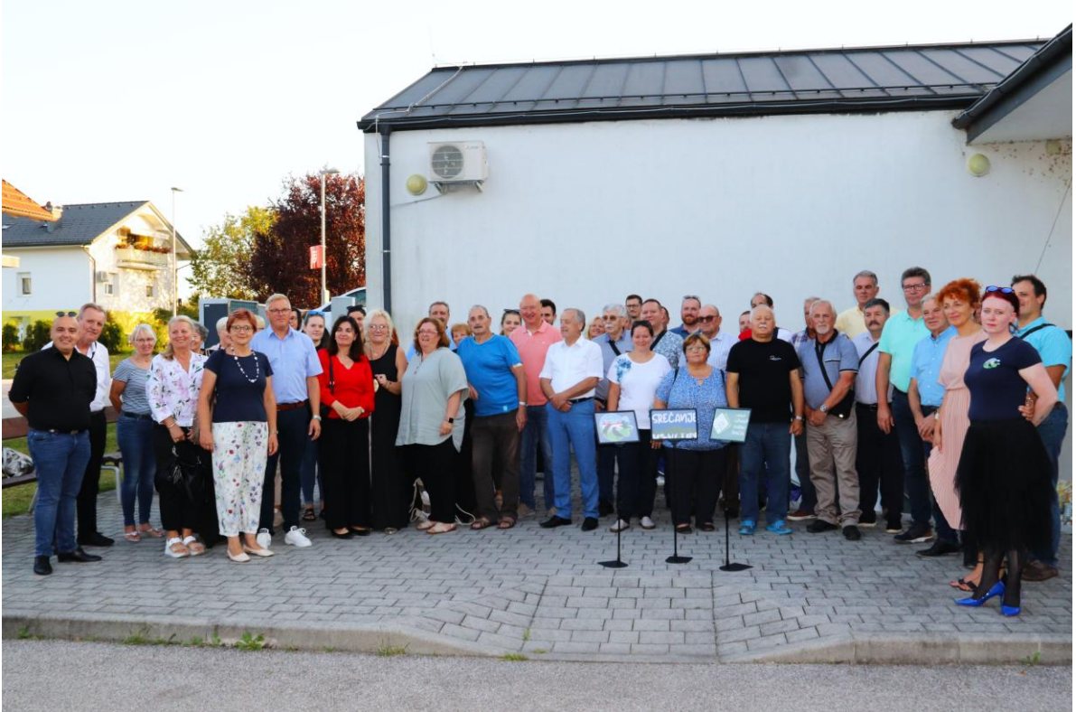
Slika 4: Skupinska fotografija 12. srečanja Zveze kulturnih društev Brežice