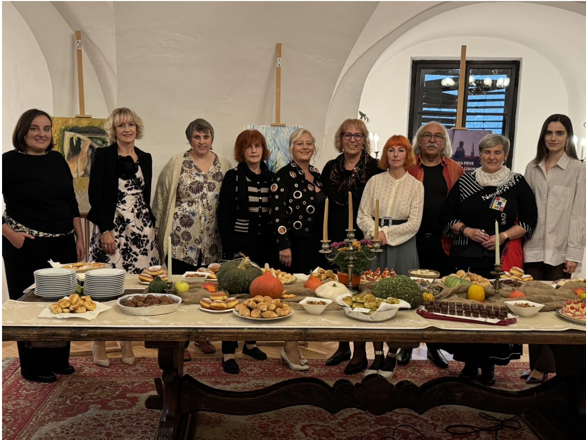
Slika 9: Skupinska fotografija članov likovne sekcije Mokrice iz razstave na Mokricah leta 2024