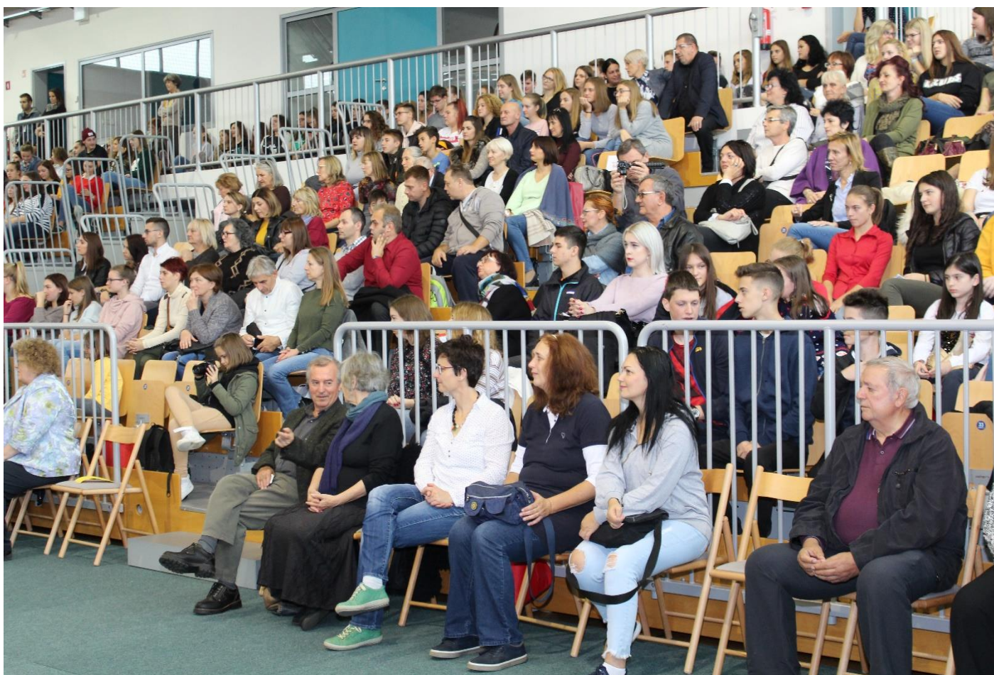
Udeleženci projekta so napolnili dvorano/ Project participants filled the hall