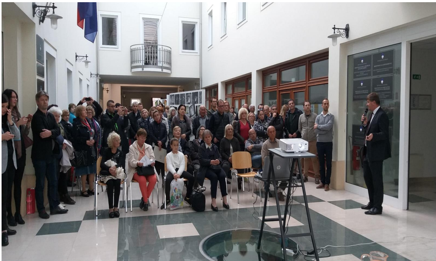
Evropski poslanec Franc Bogovič je predstavil delovanje EU, volitev v evropski parlament, viziji pripadnosti evropskemu državljanstvu in tudi odgovarjal na vprašanja / MEP Franc Bogovič presented the functioning of the EU, the elections to the European Parliament, the vision of belonging to European citizenship, and also answered questions