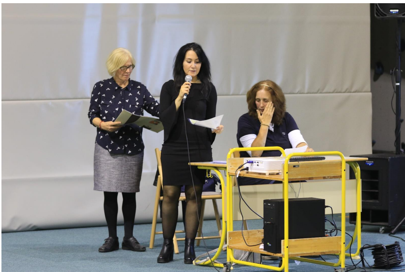
Podelitev priznanj in potrdil avtorjem mednarodnega likovnega, foto in video natečaja za mlade pod krovnim naslovom »Tudi moj dom je del Evrop.«/ Awarding and acknowledgment to the authors of the international art, photo and video competition »My home is also a part of Europe.«