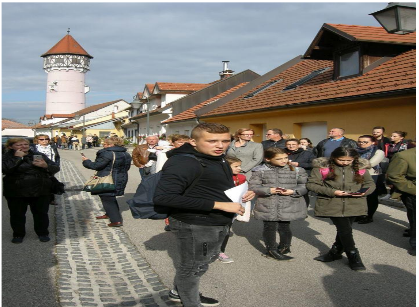
Ekскурzija po poti evropske kulturne dediščine – staro mestno jedro Brežice / Excursion along the European Heritage Route - the old town of Brežice /