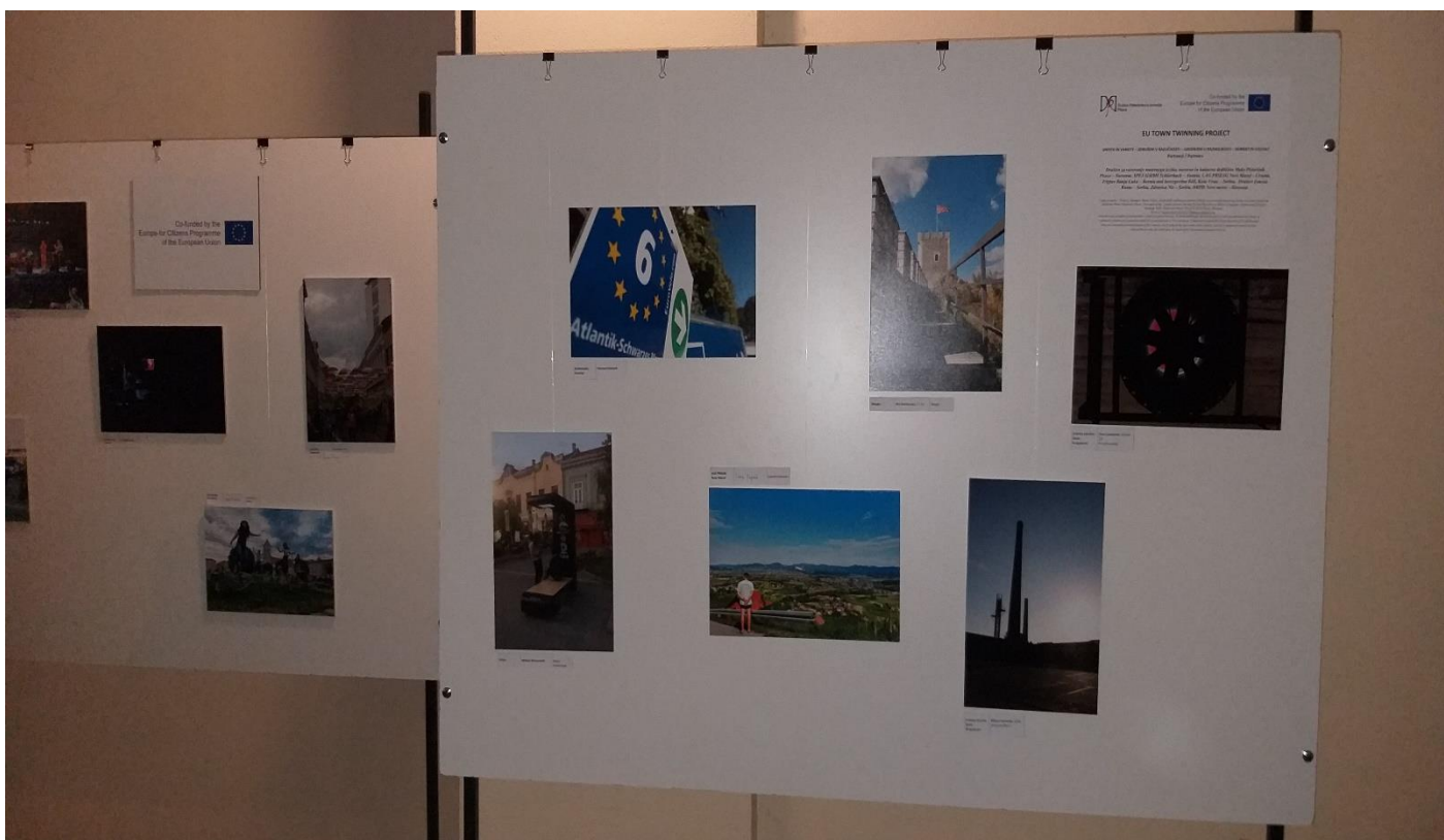
Mednarodni likovni, foto in video natečaj na temo Tudi moj dom je del Evrope, je vzbudil veliko zanimanje pri mladih do 25. leta v vseh partnerskih državah, za razstavo pa je bilo izbranih 50 primernih del / The international art, photo and video competition on the topic "Also my home is a part of Europe" has attracted a lot of interest in young people by 25 years in all partner countries, and 50 eligible works were selected for the exhibition.