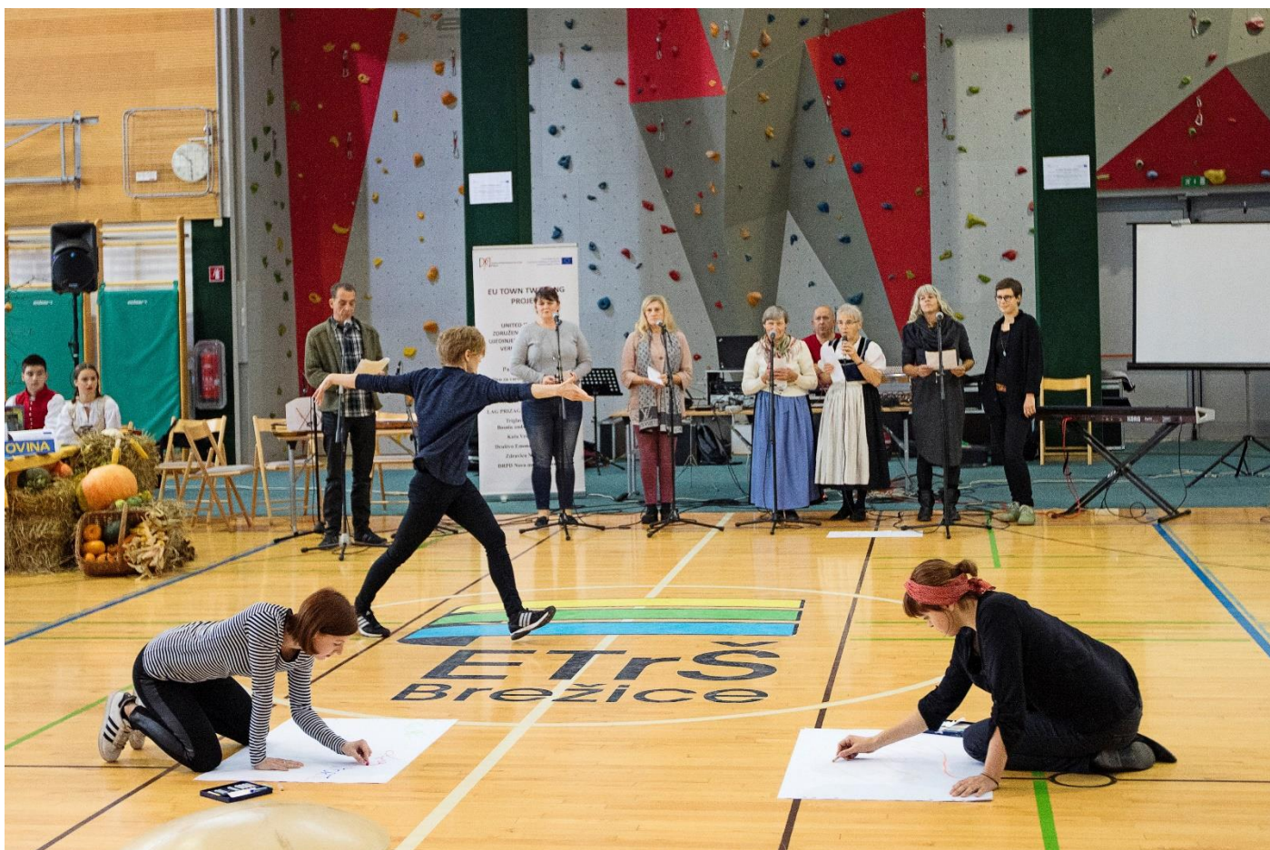
Multimedijska predstava kulturniškega tima partnerja iz Avstrije je vzbudila veliko zanimanje /The multimedia performance the cultural team of the partner from Austria aroused great interest