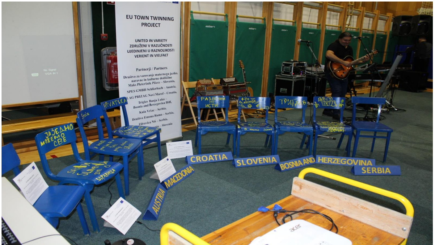
Rezultati delavnice Živi slovar – pisanje gesel in parol na temo medkulturnosti in evropskega državljanstva v modri in rumeni barvi. / The results of the workshop Live Dictionary - writing passwords and paroles on the topic of interculturality and European citizenship in blue and yellow colour.