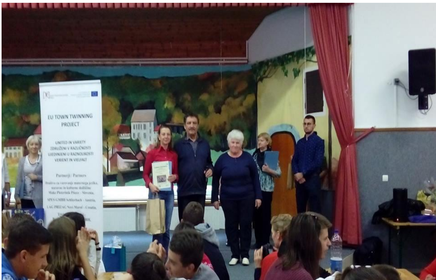
Zaključek z izmenjavo podpisanih listin o nadaljnjem sodelovanje med društvi in kraji / Conclusion by the exchange of signed documents on further cooperation between societies and places