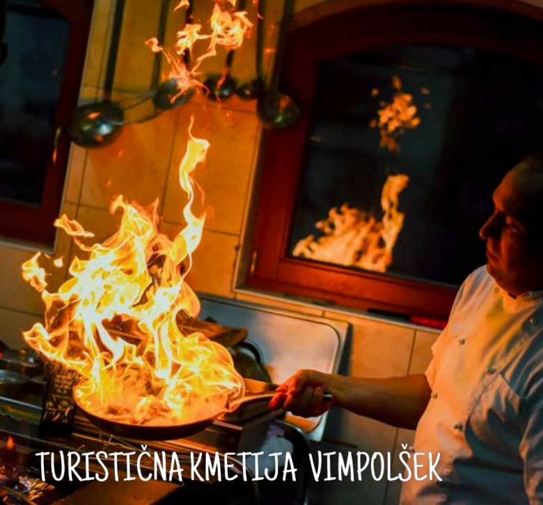
TURISTIČNA KMETIJA VIMPOLŠEK