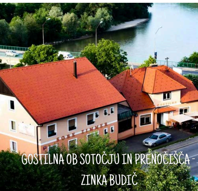
GOSTILNA OB SOTOČJU IN PRENOČIŠČA - ZINKA BUDIČ