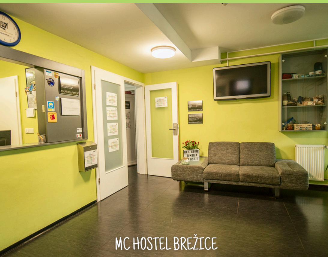
MC HOSTEL BREŽICE