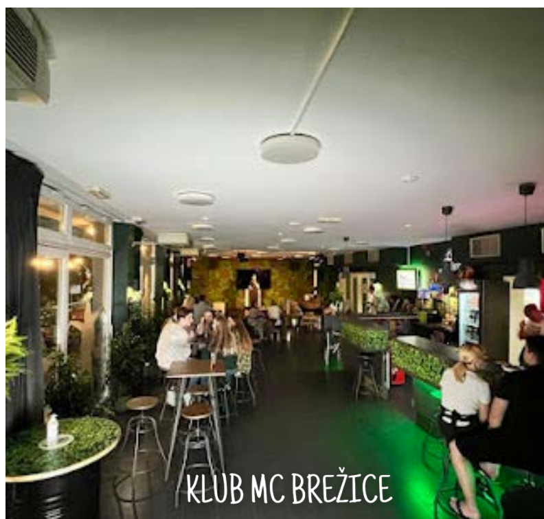
KLUB MC BREŽICE