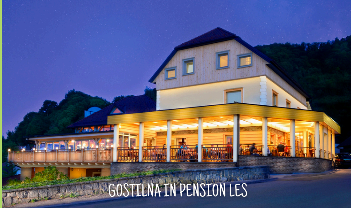
GOSTILNA IN PENSION LES